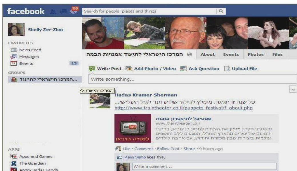
קבוצת הפייסבוק של המרכז הישראלי לתיעוד אמנויות הבמה

מחקר תאטרון. אתם מוזמנים להפוך לחברים בקבוצת פייסבוק זו, להיחשף לחומרים המגוונים המצויים בארכיון המרכז, להתעדכן באופן שוטף על חומר חדש אשר מגיע למרכז, ואף לתרום משלכם על יצירות שאתם מעורבים בהן, ועל עבודתכם המחקרית. כתובת הקבוצה היא: /http://www.facebook.com/#!/groups/433999003290216