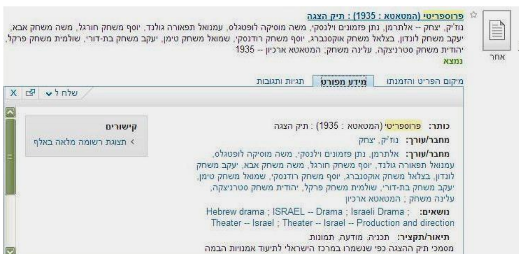
רשומת תיק הצגה בקטלוג דעת"א