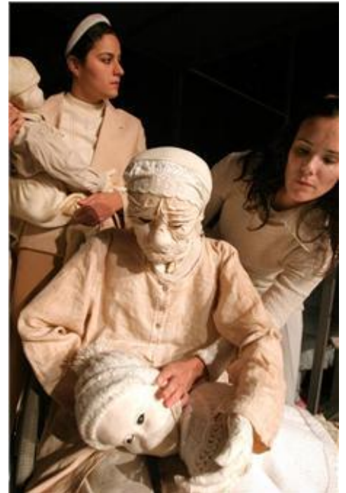
תמונה מתוך "חורף בקלנדיה" (התאטרון הערבי עברי 2006).