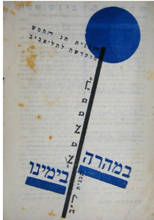
תכניית ההצגה במהרה בימינו (המטאטא 1934)