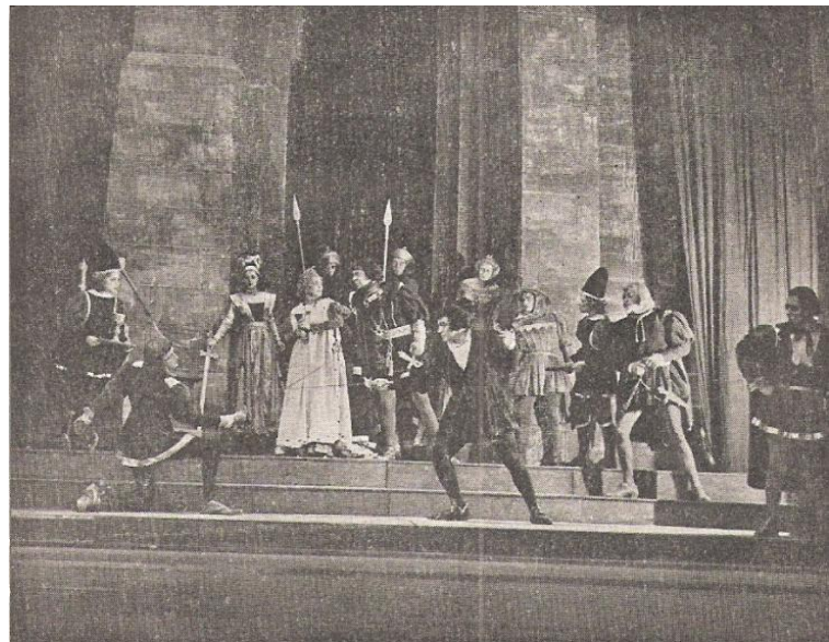
צילום מתוך המלט (הבימה 1947)