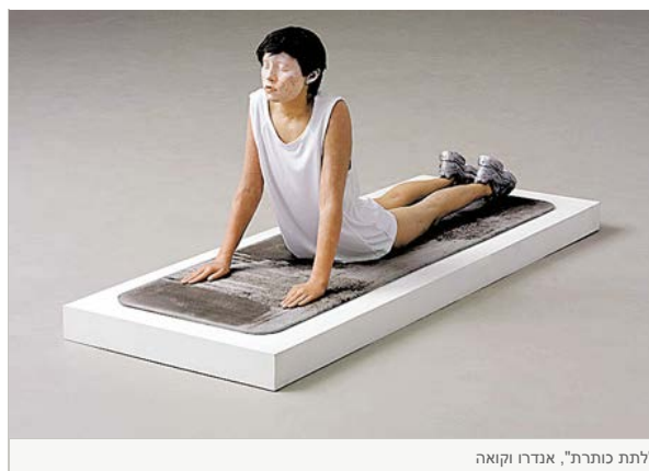
"לתת כותרת", אנדרו וקואה

במרכזה של "קירות נמסים", שאצרה שרית שפירא, נמצא המושג "קיר" במובנו האדריכלי או התיאורטי. בחלק מהעבודות קל להבחין ב"קיר" הזה, באחרות קשה, אבל זה לא גורע מהאפשרות ליהנות מהן. אחת העבודות המוצלחות היא "Mirror Wall" של האמן ההולנדי יפ היין, העשויה משטח גדול דמוי מראה שמייצר ויברציות כאשר הוא קולט בחיישניו את הצופה המתקרב. הוויברציה שמתווספת לאפקט המראות המעוותות מחזקת את תחושת הערעור וחוסי היציבות של הצופה. העבודה "לתת כותרת" של האמן הגיאורגי אנדרו וקואה מציגה אשה בתנוחת הקוברה מעולם הייגה. הקיר הפעם הוא המשטח שעליו היא מתוחה, וגם הקיר הדמיוני בינה ובין הקהל.