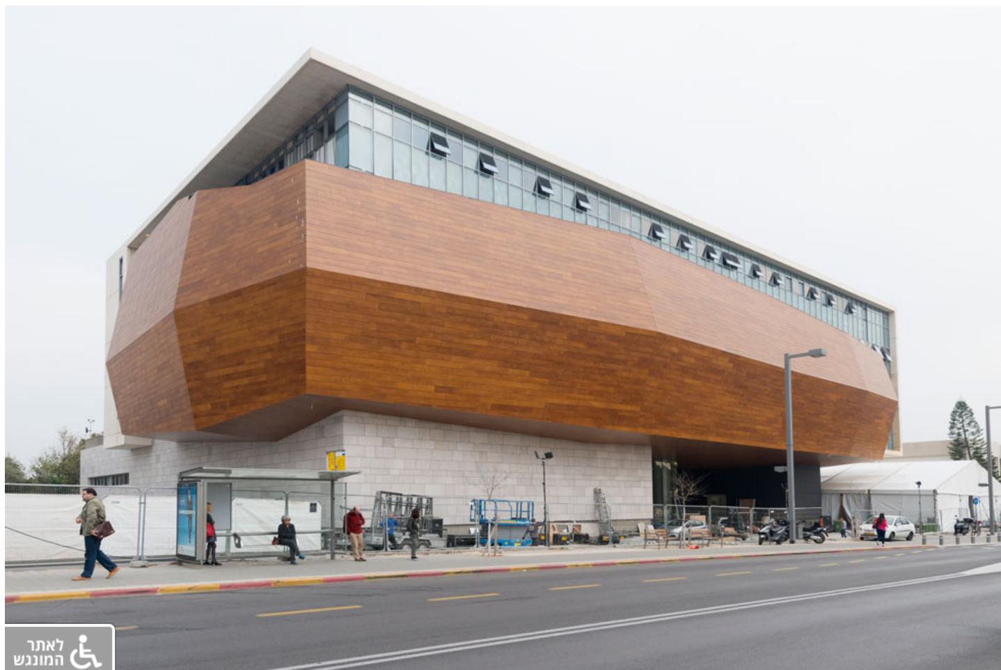
עוד בניין משמעותי בדופן הקמפוס: מוזיאון אוספי הטבע, שעתידי להיחנך באוקטובר. לחצו על התצלום לכתבה עליו