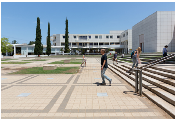
צמוד לרחבת הכניסה הראשית של האוניברסיטה

כדרכה של קבוצת עזריאלי בקניונים שלה, הבניין יהיה בולט מאוד: הכי קרוב לשער הראשי של האוניברסיטה, מול מעונות הסטודנטים הישנים, וכפול בשטחו מבית הספר הקיים – 5,000 מטרים רבועים בנויים. בקרן עזריאלי שואפים לשדרג את מעמדו של בית הספר, כך שיהיה בשורה ראשונה עם מוסדות לימוד מובילים בעולם, ומתיימרים לנקוב בשם של הרוארד בארה"ב ו-AA בלונדון.