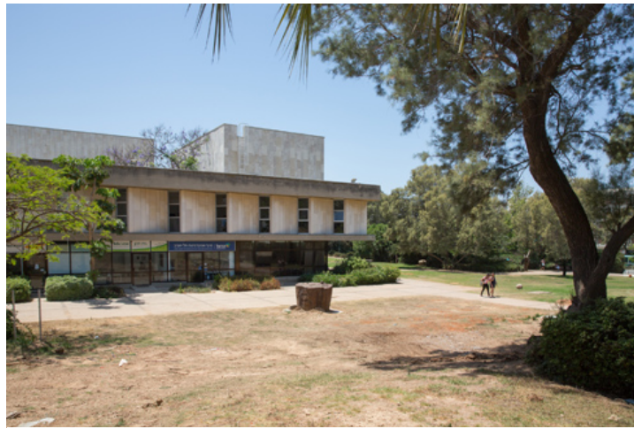
השטח המיועד לבנייה

מדוע דווקא בית ספר לאדריכלות, שאמור לחרות על דגלו את קידום האדריכלות בישראל, יוצא לתחרות מוזמנים שתאפשר לארבעה משרדים בלבד להשתתף בה?