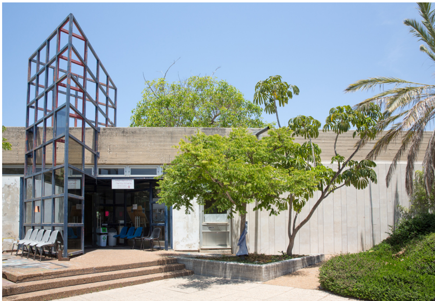
בית הספר הנוכחי. תוכנן במקור כחדר אוכל, ובמרוצת השנים עלה מספר הסטודנטים - בשעה שהמבנה אינו הולם את השימושים