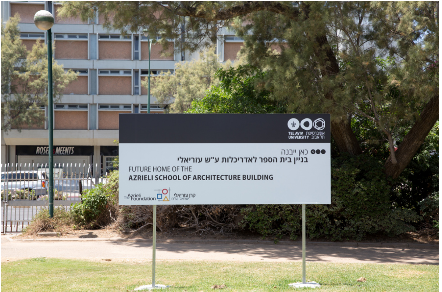
כדרכה של קבוצת עזריאלי בקניונים שלה, הבניין יהיה בולט מאוד: הכי קרוב לשער הראשי של האוניברסיטה, מול מעונות הסטודנטים הישנים, וכפול בשטחו מבית הספר הקיים – 5,000 מטרים רבועים בנויים. בקרן שואפים לשרדג את מעמדו כך שיהיה בשורה ראשונה עם המוסדות המובילים בעולם