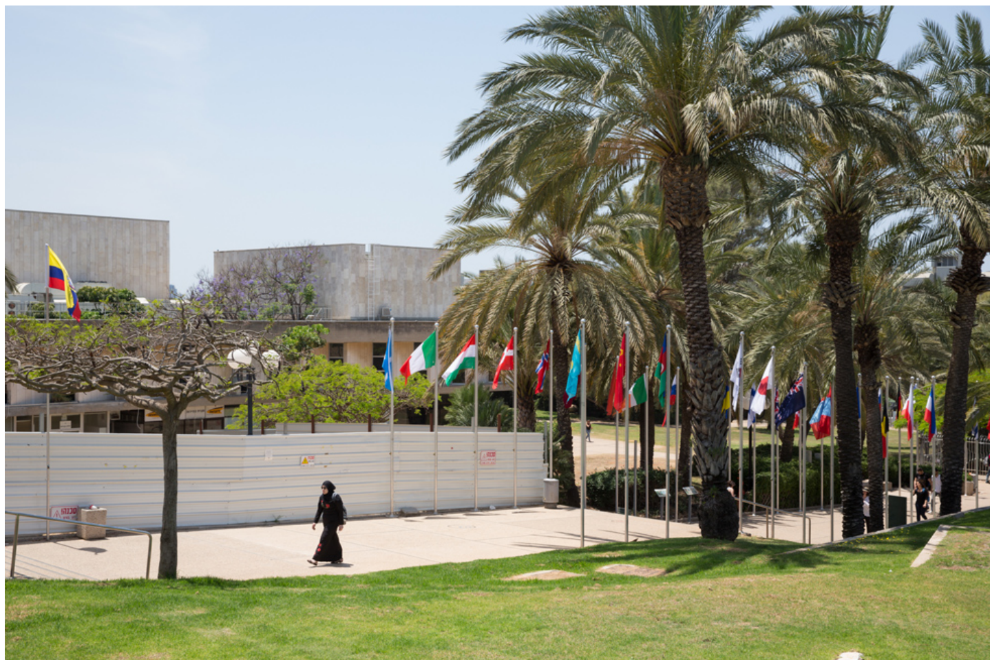
הבניין החדש יקום במשבצת פנויה בין בית הספר למוזיקה לבין רחוב איינשטיין, ויגוס בגדר הקמפוס הקיימת