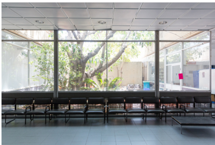
בית הספר למוזיקה, אחד מהבניינים הראשונים בקמפוס, יוסתר בגלל הבניין העתידי

ההסבה של חדר האוכל לבית ספר גבתה מהבניין מחיר. שתי החצרות הפנימיות שחצובות בלב המבנה מוזנחות, החללים הגדולים חולקו לכיתות לימוד קטנות שבחלקן אין אפילו חלונות, ומצוקת המקום העבירה חלק מהחדרים למרתף. תוך כדי הידרדרות המבנה, עלה מספר הסטודנטים והתוצאה היא תנאי לימוד בעייתיים.