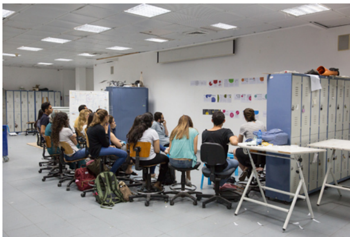
בית הספר לאדריכלות של אוניברסיטת תל אביב. מצטופף והולך

כיום ממוקם בית הספר לאדריכלות בבניין דה-בוטון בקמפוס, שאותו תכנן האדריכל נחום זולוטוב במקור כחדר אוכל. כאשר הושלם ב-1966, היה אחד המבנים הראשונים שנחנכו בקמפוס הצעיר. המבנה החד-קומתי רוכב על שיפול טופוגרפי וחושף חצי קומת מרתף. במרכזו, שתי חצרות פנימיות שמחדירות אור לעומק החללים ההיקפיים.