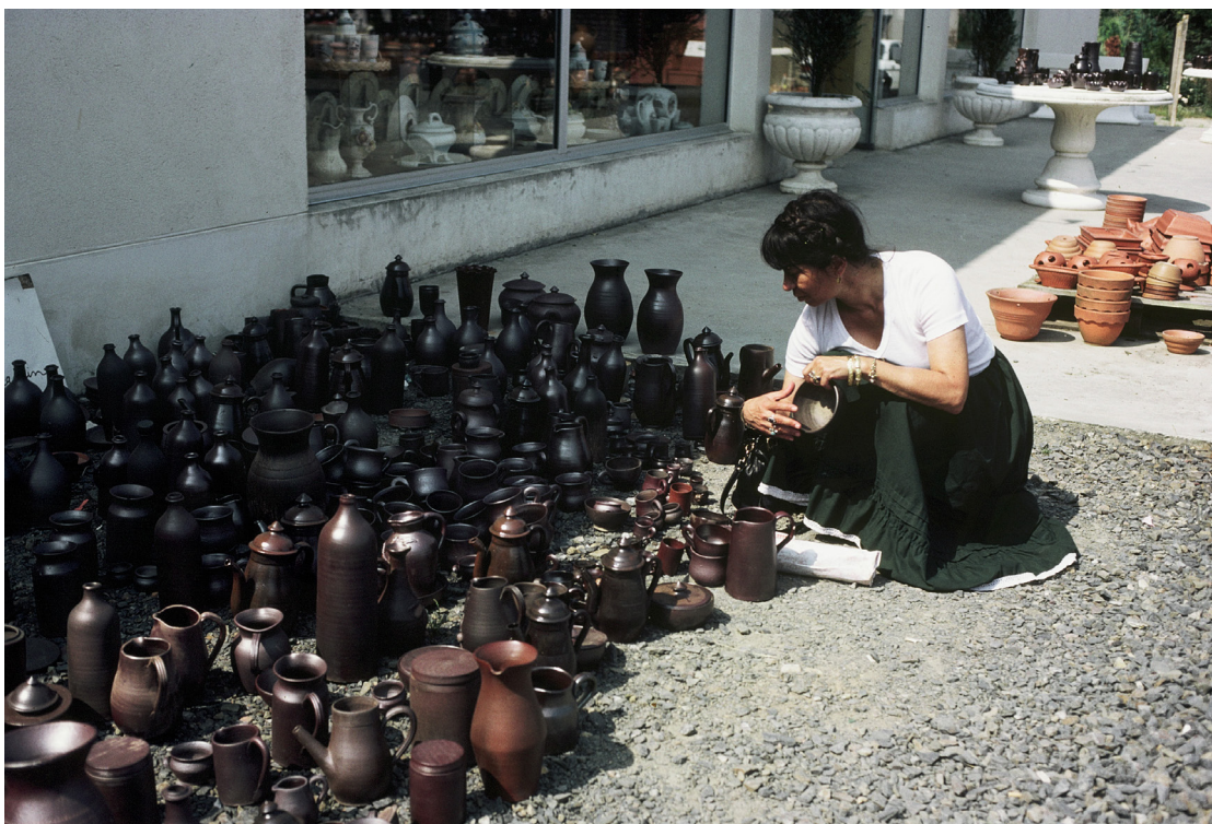
תמונה 1: באייה (Bayeux), 1983.