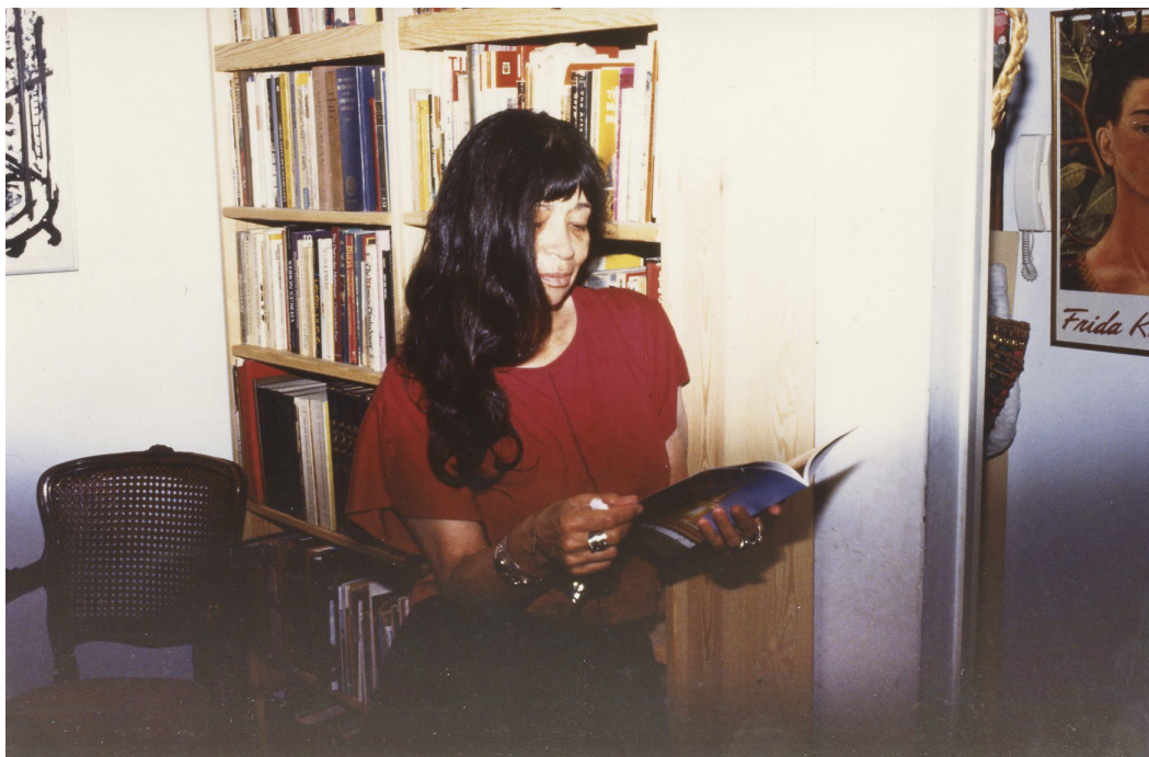
תמונה 3: אביב 1993, רמת גן.

בשפה האנגלית Assaph – Studies in Art History , אשר השניים שימשו עורכיו. כתב העת היה לאכסניה בינלאומית נכבדת בה משתתפים חוקרים מארצות שונות.