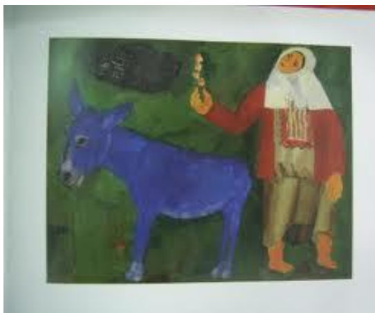
ערבייה וחמור כחול – פנחס ליטבינובסקי (1925 בקירוב)

לחמור מקום מיוחד אצל גוטמן. כמעט בכל אחד מספריו וסיפוריו משתרבב חמור. ב"עיר קטנה ואנשים בה מעט" אלו חמורים היסטוריים כחמורו הלבן של הרופא ד"ר חיסין, חמורו הנמרץ של החלבן רב שעה וכמובן חמורי הערבים, ב"שתי אבנים שהן אחת" אלו החמורים מימי ראשית ההתיישבות היהודית, בכריכת "החופש הגדול או תעלומת הארגזים" מאויר חמור על אף שאינו נזכר בסיפור וב"שביל קליפות התפוזים" משתלב בעלילה חמור הבורח מבעליו ולוקח חלק בהרפתקאות שונות. אבל עם כול חיבתו העזה לחמורים, גוטמן אינו הראשון המעניק להם מקום של כבוד. לחמור מבחר מייצג בספרות העברית לדורותיה 31 . החל מהחמור והאתון המקראיים שמתפקדים כסמלי סטאטוס ועושר בספרות המקראית, דרך אתונו הדוברת של בלעם וחמורו של המשיח, עבור בחמור התמים והכסיל בספרות המדרשית וכלה בחמור הערבי שכיב לא רק בסיפוריו של גוטמן אלא במבחר מהיצירה הארץ-ישראלית, המצוירת והכתובה.