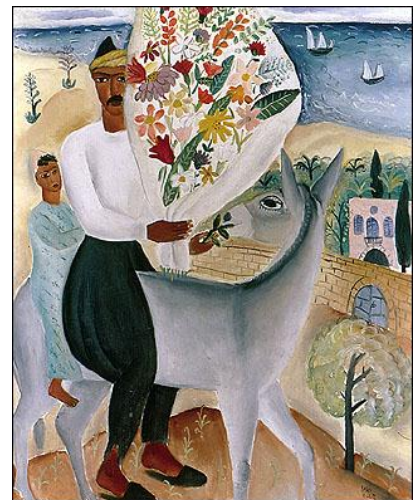
רוכב עם זר פרחים – ראובן רובין (1923)