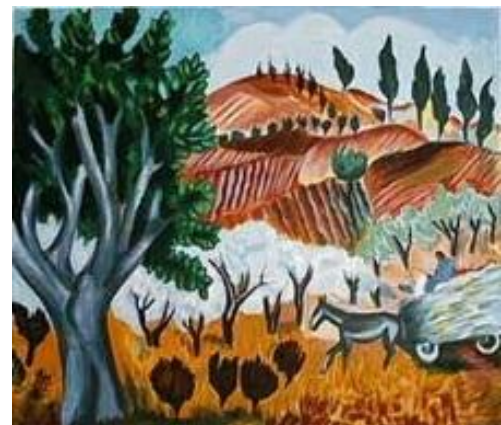
נוף ירושלמי – ישראל פלדי (ללא תאריך)