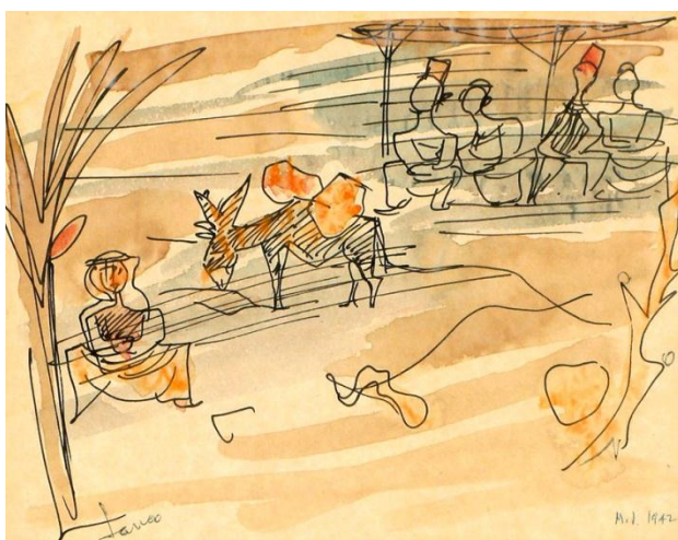
דמויות וחמור – מרסל ינקו (1942)